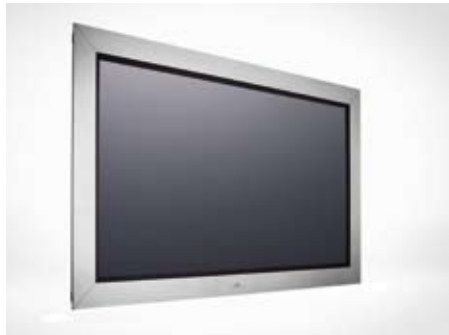
Professioneller Flachbildschirm in Edelstahlausführung.

Arthur Holm ist das Ergebnis einer Kombination aus skandinavischer Designtradition und spanischer Emotionalität. Das Unternehmen bietet herausragende, elegante Lösungen sowie die Vielseitigkeit und nötige Flexibilität bei 100% kundenorientierten Lösungen.