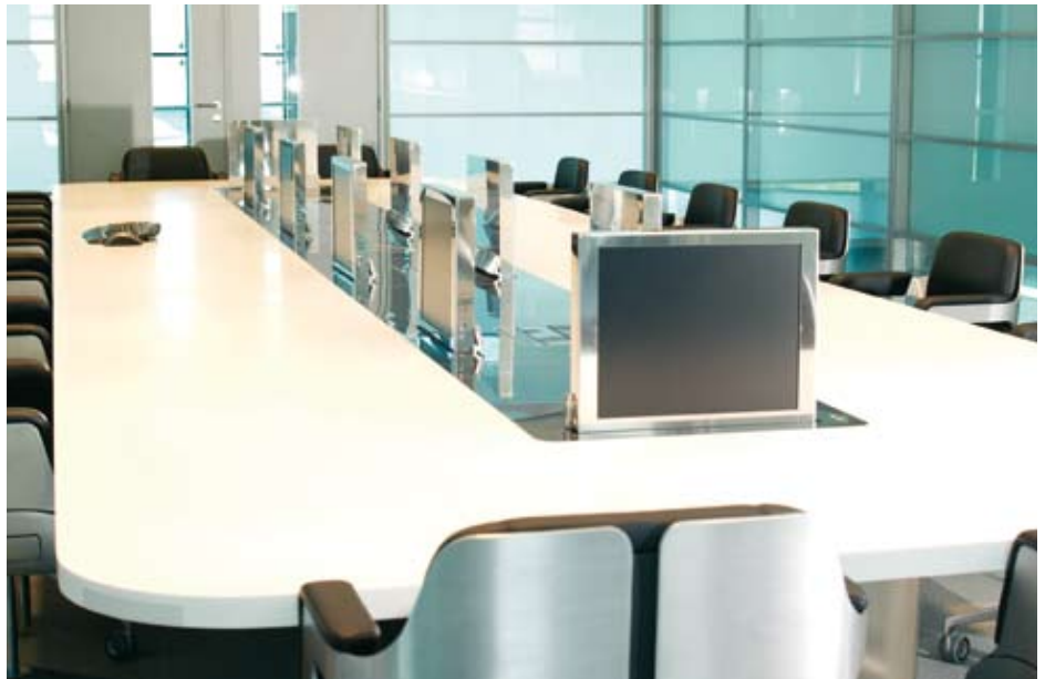
Dynamic1 Monitorlösung in poliertem Edelstahl-Gehäuse Design & Produktion: GESAB, S.A.

Porsche Stuttgart Stadtrat von Luxemburg WALTER KNOLL Herrenberg KBC Bank Brüssel AGBAR Gas Natural Handelskammer von Valencia Hafen von Valencia Banco de España Caja Madrid Caja Navarra Caja Duero Ceca La Caixa Inmobiliaria Colonial Gestamp Distrito C de Telefónica Ausstellungszentrum von Valencia Ausstellungszentrum von Barcelona Conseil Régional du Nord PAAET Kuwait