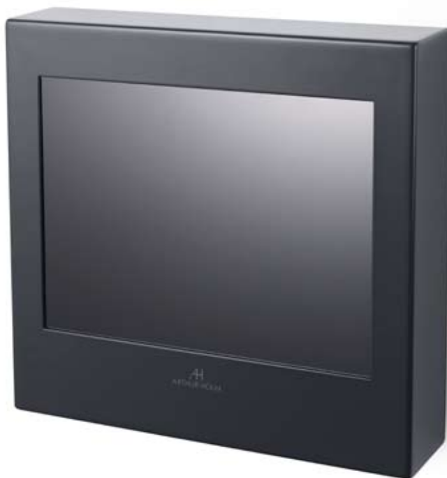
10,4" Rise Monitor in schwarz lackiertem Metallgehäuse und mit einer spezieller Schutzscheibe versehen.

Überall, wo wechselnde Informationen angezeigt werden sollen und ein Einbau in die Wand nicht möglich ist, heißt die ideale Lösung: Rise von Arthur Holm! Diese kompakte Monitor-Variante ist eine komplett unabhängige Stand-Alone Lösung mit externem Netzteil und bietet eine bereits integrierte Wandbefestigung, ausgerüstet mit einem Sicherheits-Verschluss zum Schutz vor Diebstahl.