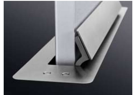
Großaufnahme der Bedienelemente zum Ausfahren und Versenken des Monitors.