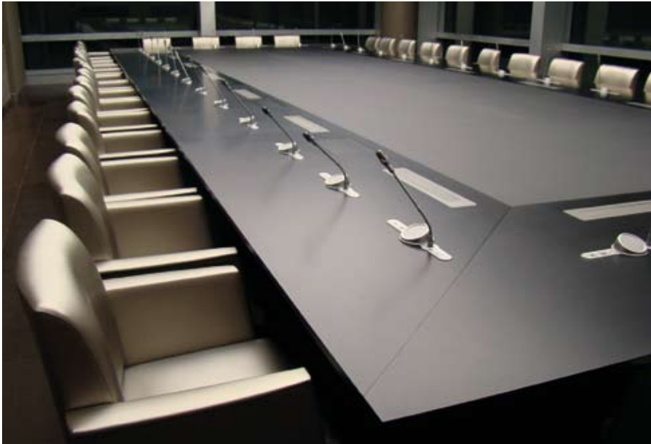
Konferenzraumtisch mit integrierter Arthur Holm Dynamic1 Monitorlösung, im eingefahrenen Zustand.