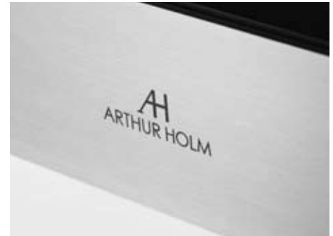
Viel Liebe zum Detail verspricht die exklusive Static-Serie