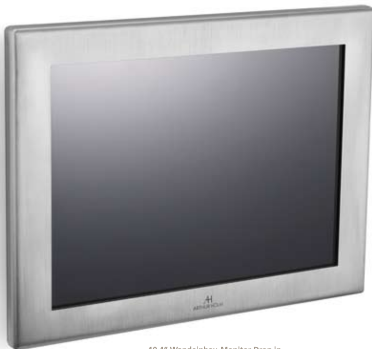
10,4" Wandeinbau-Monitor Drop in Edelstahlausführung zur Integration in die Wand oder anderen Flächen

Die „In-Wall“ Monitore Drop lassen sich leicht in die Wand integrieren. Der Clip-On Einbaurahmen, der dann einfach aufgesteckt wird, sorgt für einfache Installationen und für den sorgenfreien, schnellen Zugang im Servicefall. Die Clip-On Einbaurahmen erhalten Sie in gebürstetem Edelstahl oder in der Farbe Ihrer Wahl lackiert. Drop & Rise sind die Namen für unsere Informations-Monitorserien.