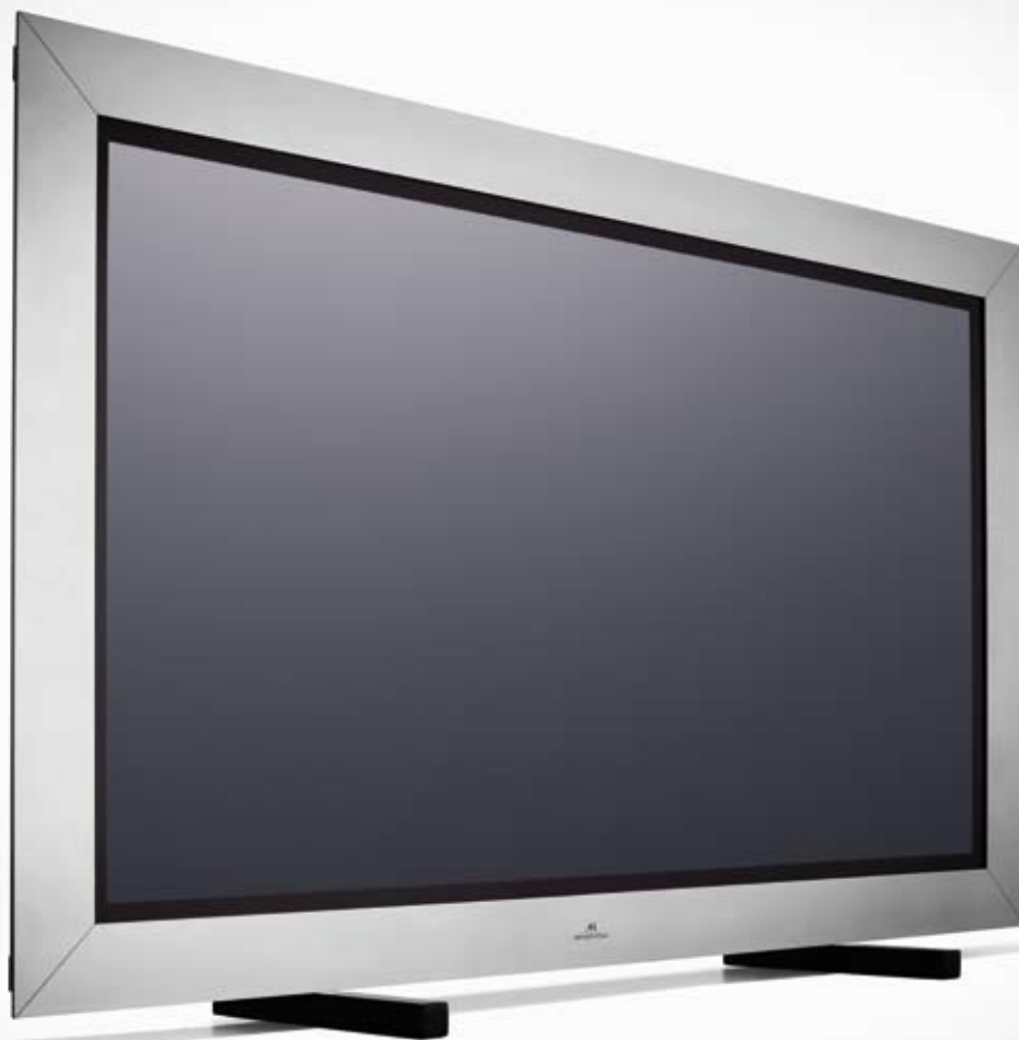
42" Monitor Static in Edelstahlausführung, Bedienungselemente nicht sichtbar auf der Geräterückseite