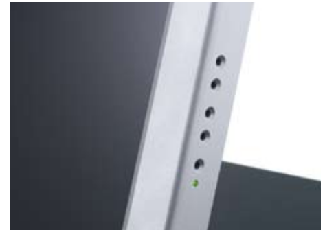
Seitliches Bedienfeld für Bildeinstellungen mit Hilfe eines Stiftes.