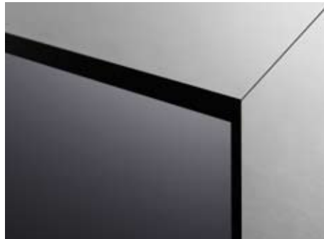
Detailansicht Edelstahlrahmen und Schutzscheibe

Static Monitorsysteme sind standardmäßig in den Bildschirmdiagonalen 32", 37", 42", 46" und 57" erhältlich. Größere Ausführungen auf Anfrage.